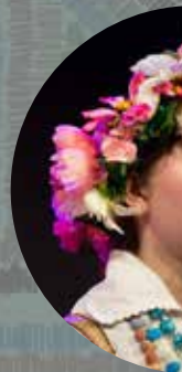
ОЛЯ ЯГ (8)