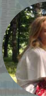
ТОНЯ ЖЕ... (1, ...)